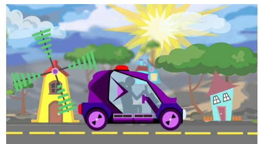
Ilustración y animación 2D

Proyecto de Illustrator + Photoshop + ANIMATE + PREMIERE PRO